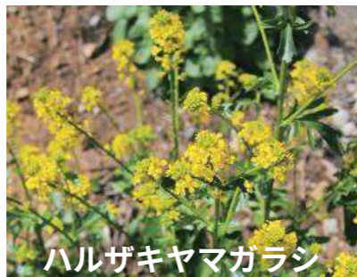
ハルザキヤマガラシ