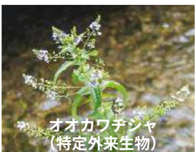
オオカワテシャ (特定外来生物)