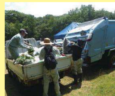
除去した植物の処分

除去した植物の一部。長年の除去活動の甲斐あって、オオハンゴンソウは戦場ヶ原や小田代原ではほとんど目になくなりました。