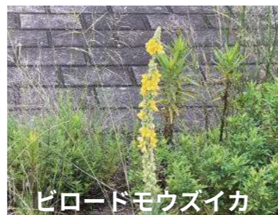
ピロードモウズイカ