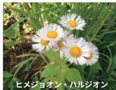
ヒメジヨオン・ハルジオン