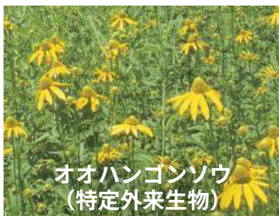
オオハンゴンソウ (特定外来生物)