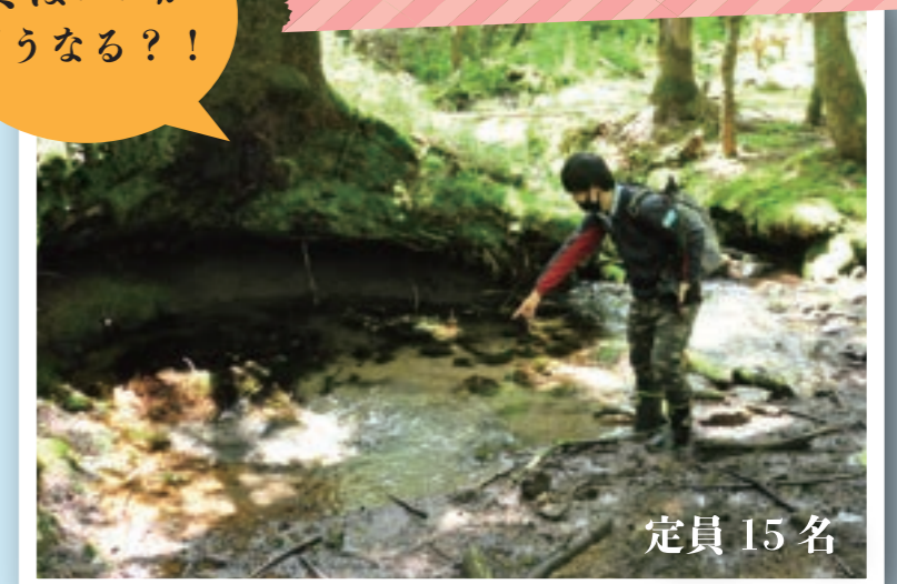
対象：現地に集合できる小学5年生以上の方 集合場所：光徳無料駐車場