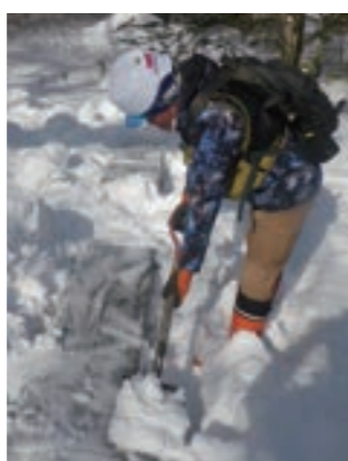
▲普段の仕事の様子 雪に埋もれたベンチの雪かきをして、 お客様が使えるようにしています！

奥日光は湖や滝、湿原など、コー スによって見られる景色が変わりま す。つい、あれもこれもと予定を詰 め込んでしまいがちですが、前述し たとおり、ハイキングにおいても『ほ どほど』が大切です。