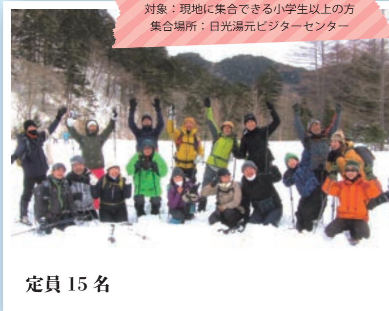
対象：現地に集合できる小学生以上の方 集合場所：日光湯元ビジターセンター