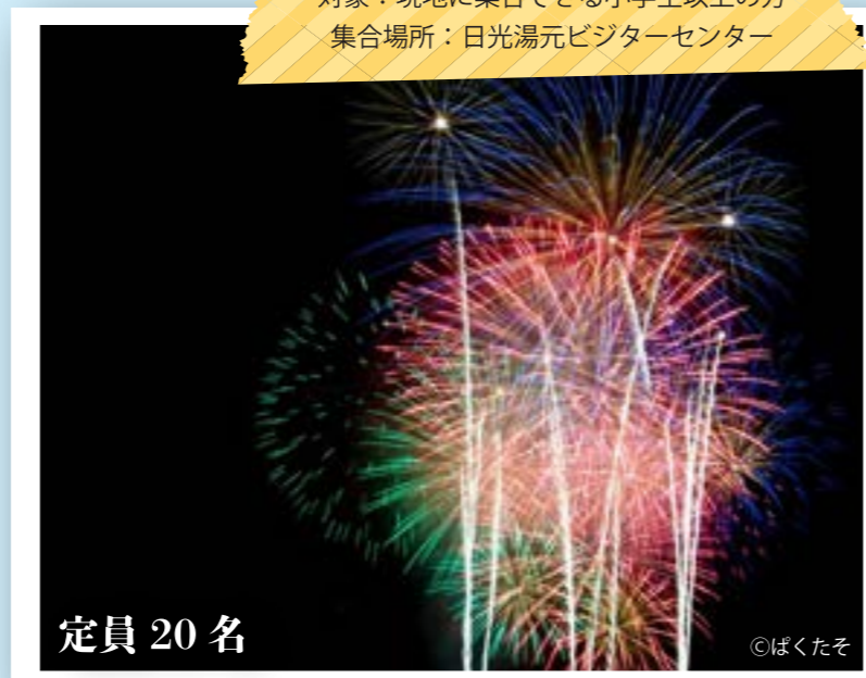
対象：現地に集合できる小学生以上の方 集合場所：日光湯元ビジターセンター