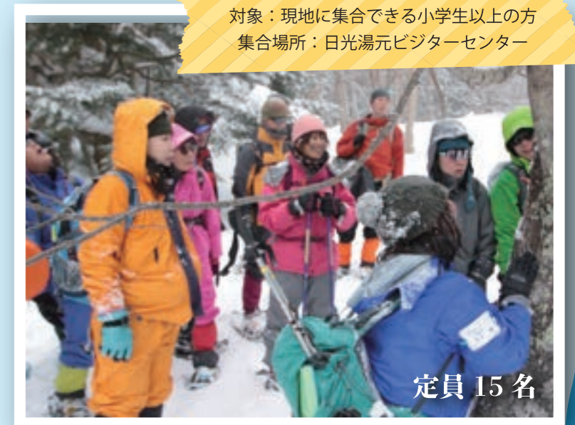
対象：現地に集合できる小学生以上の方 集合場所：日光湯元ビジターセンター