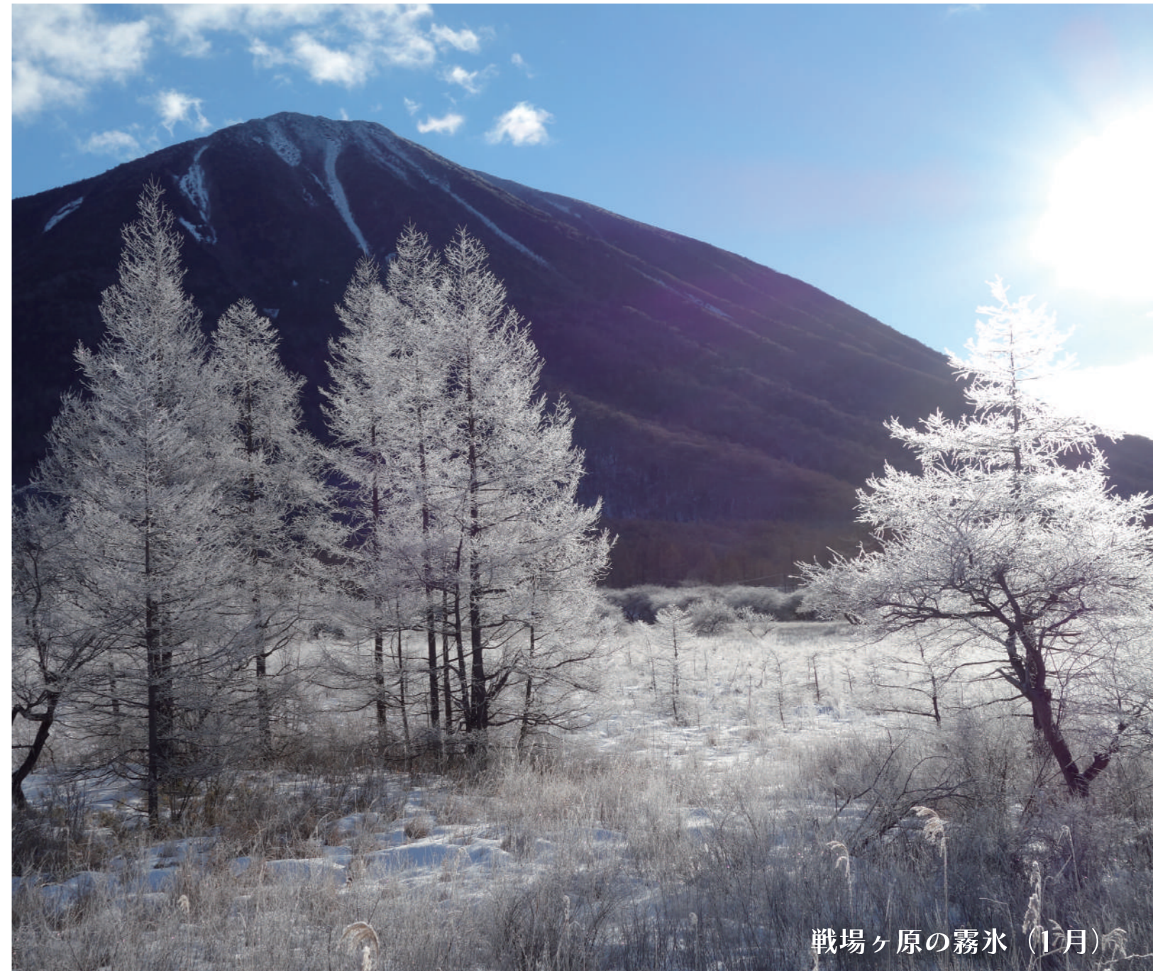
戦場ヶ原の霧氷 (1月)